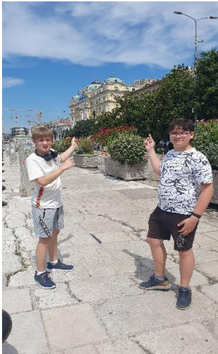
Adria Magyar Királyi Th. Rt.

Útunk során láttuk az Adriai Magyar Tengerhajózási Rt. épületét, valamint az egykori Európa szálló falán elhelyezett Jókai Mór emléktáblát. Az író nagy rajongója volt Rijekának, ezért a szállóban állandó szobát tartottak fenn számára. Láttuk még a Kormányzói Palotát, ami ma Tengerészeti Múzeum; a római kaput, Szent Vid templomát, a korzón az Óratornyot, illetve a Nemzeti Színházat.