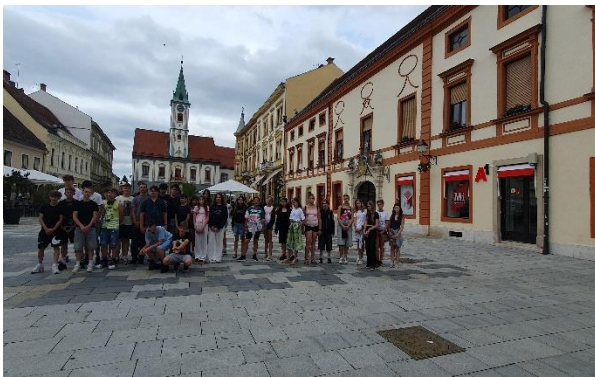
Varasd – Városháza

Sétánkat a szép barokk belvárosban kezdtük. Láttuk a régi csatornafedőket, a Megyeházát, az 500 éves Városházát, a monumentális Szent Miklós templomot, a Zsinagógát, az 1600-as évekből származó ferences templomot, az orsolyita templomot, a Draskovics Palotát. A Draskovics család a környék leggazdagabb emberei voltak. Fotózkodtunk Grgur Ninski horvát pap szobránál, akinek a lábát meg kellett simogatni. A varasdi háborús emlékmű maradványait, a templomfalon Zrínyi Miklós portróját.