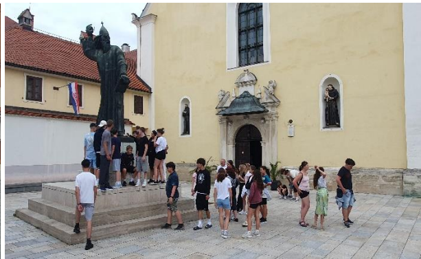
Grgur Ninski pap szobra a ferencesek templomával

Városnézésünk során felkerestük az Erdődyek várkastélyát. A vár a török elleni végvár szerepét töltötte be egykor. Az Erdődy család birtokolta legtovább, mégpedig 1925-ig. Ma múzeum működik benne.