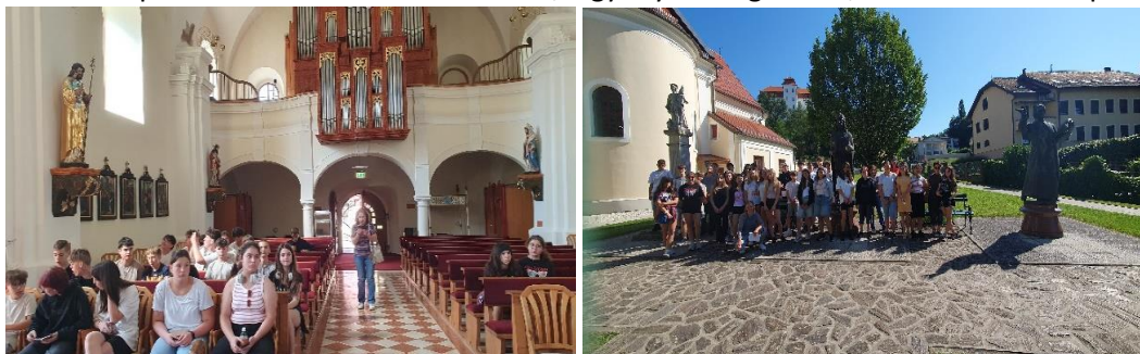
Alexandriai Szent Katalin templom

Reggel negyed 7-kor indult a csapat Écsről az iskolától. Kb. két és fél óra utazás után érkeztünk meg első állomásunkra, a szlovéniai Lendvára. Elsőként megnéztük az Alexandriai Szent Katalin plébániatemplomot a XIII. századi szószékkel, a gyönyörű orgonával, a XVI. sz-i táblaképekkel.