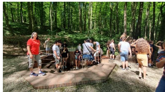
Szent Vid forrás

Lendva után az Őrvidék egyik kiemelkedő településére, Bántornyára utaztunk tovább. A Bánffy családhoz fűződő Árpád-kori templomban román és gótikus stílusjegyeket figyelhettünk meg, falain gyönyörű freskókkal.