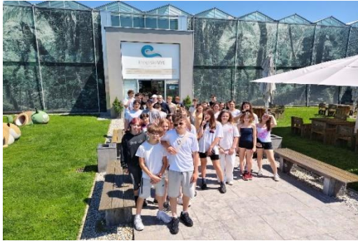
Orchideafarm kívül –