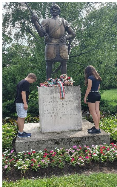
Koszorúzás Zrínyi Miklós szobránál

Az esti órákban érkeztünk meg Écsre. Három napos kirándulásunk során sok olyan helyen jártunk, mely valamikor a mi országunkhoz tartozott. Sok történelmi és kulturális értéket, kapcsolatot láttunk mindennek bizonyítékaként. Rengeteg információval és élménnyel gazdagodtunk. Köszönetünket fejezzük ki a pályázat lehetőségéért és a megvalósításért.