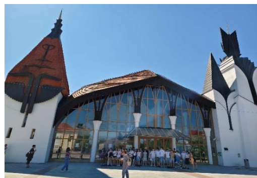
Lendvai Színház- és Hangversenyterem

Ezután a Muravidék ősi földjén megtekintettük a Bánffy-Esterházy kastélyt, amely ugyan nem a térség legnagyobb, legékesebb kastélyai közé sorolandó, viszont nagyon jelentős kulturális színtér különböző kiállításával az ott élő magyarok számára. Betekintést nyerhettünk a Bánffy, Nádasdy, Esterházy családok életének történetébe. Láthattuk a hetési népviselet, továbbá Zala György szobrász, illetve a kortárs festők alkotásait. Rövid filmben ismerkedtünk meg Lendva látnivalóival, nevezetességeivel, programjaival – például ernyőgyártás, nyomdászat, Zsinagóga, zsidó temető, Muránia kerékpárközpont, fáklyás gyalogtúra, Pannon világítótorony, helyi ingyencégek, bográcsfőzőverseny, bornapok, horgásznapiok, halászlé főzőverseny, szüreti vígasságok, gyógyfürdő, lendvai művésztelep. A kisfilmben láthattuk a Szentháromság kápolnát, amelyben őrzik Hadik Mihály, a törökverő hadvezér üvegkoporsóját és különleges, mumifikálódott holttestét. Mindemellett láthattunk egy csodálatos lepkegyűjteményt is. A kastély meglátogatása után rövid városi séta során útba ejtettük a Magyar Nemzetiségi Művelődési Intézetet, a Zsinagógát, a Makovecz Imre tervezte színházat .