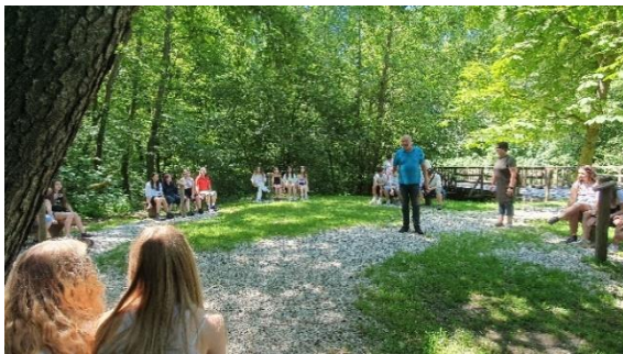
töltődés a Bakonaki-tó melletti energiapontoknál

A település határában elsétáltunk a Bakonaki-tó mentén a Szent Vid kápolnához és Szent Vid forráshoz, ahol kóstolhattunk a frissítő vízből. A séta során az ott működő energiapark egyes pontjainál energiával töltöttünk, amelyekkel különböző szervi bajokat lehet orvosolni.