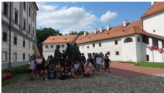
Zrínyi vár - Csáktornya