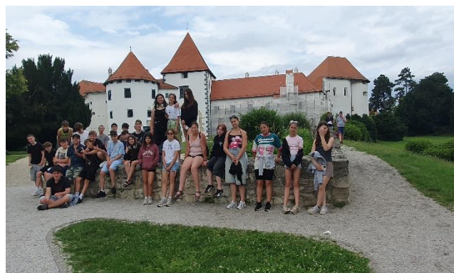
Varasd vára →

Folytattuk utunkat a Zrínyiek nyomában. Csáktornyan szinte minden Zrínyi Miklósról szólt. Megnéztük a várat, láttuk a Zrínyi szoborcsoportot, a Zrínyi emléktáblát, mellyel köszönetét fejezi ki a horvát nép a hős felé. Elsétáltunk Szent Jeromos szlavóniai származású szentünk szobrához, a Zrínyi fához, Szigetvár védőjének egész alakos szobrához – ahol elhelyeztük koszorúnkat –, a háborús áldozatok emlékművéhez, Zrínyi turulmadaras emlékoszlopához.