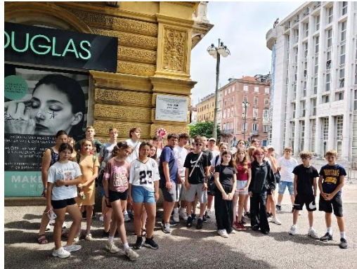
Jókai Mór emléktábla